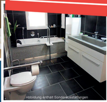
Abbildung enthält Sonderausstattungen

WASSER + LICHT Gesellschaft für Gebäudetechnik mbH